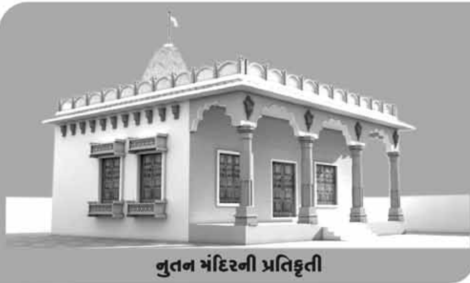
નૂતન મંદિરની પ્રતિકૃતિ

આપણે સૌ ગાલા ભાવિકો જેની ઉત્સુકતાપૂર્વક રાહ જોઈ રહ્યા હતા તે કચ્છ વાગડ ગામ લાકડીયા મુકામે શ્રી વિશલમાતા અને શ્રી જષ્ણદેવનું અલૌકિક મહામંદિર (મઢ)નું નવનિર્માણ કરવાની રળીયામણી ઘડી આવી ગઈ છે. આ ભવ્ય મહામંદિર આપણા ગોઠિયા ભાઈઓના સહયોગથી બનાવવામાં આવશે. આપો અવસર ભાગ્યશાળીઓને જ મળે છે. તો ચાલો આપણને આ સુવર્ણ અવસર મળ્યો છે તેનો સંપૂર્ણ લાભ લઈએ અને આપણે પોતાની શક્તિ છુપાવ્યા વગર ઉદારતાપૂર્વક કમિટીના સભ્યોને જાણો લખાવીએ.