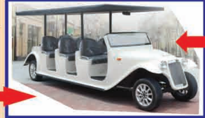
8 SEATER ELECTRIC LUXURY CART